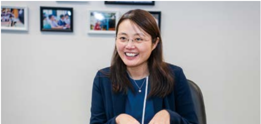
▲ 梁校長表示，自己在校內推動生涯發展的角色，主要是整合各方面的資源，定出推動項目的優次。