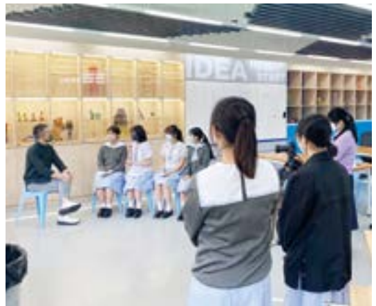
▲「學校商界顧問」(EA) 接受學生訪問，學生將從 EA 身上所學到的學以致用，製成短片並與其他同學分享。

「學校商界顧問」(Enterprise Advisor, EA) 則是一位來自商界、由 CLAP@JC 連結的義工。學校首年獲配對的 EA 是一位開設非洲鼓公司東主，他同時涉獵許多不同行業，包括