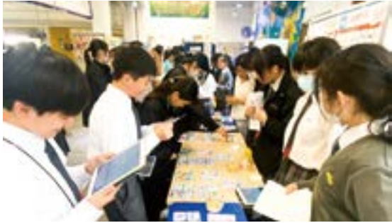
▲「生涯規劃大使」在校內擺放攤位，讓同學運用 VASK 卡認識自己。

其中一個跨基準應用的重點活動，就是培訓「生涯規劃大使」，為其安排連串體驗，並建構平台讓他們跟同學分享。獲選為生涯規劃大使的學生，首先會參加「聯校生涯發展學會」活動，與其他學校的學生共同學習生涯發展概念，並與不同行業的嘉賓交流，了解各行各業的 VASK 元素（價值、態度、技能及知識）。完成訓練後，生涯規劃大使會在校內舉辦活動，向同學介紹 VASK 等生涯規劃概念，又為中三同學提供選科支援。