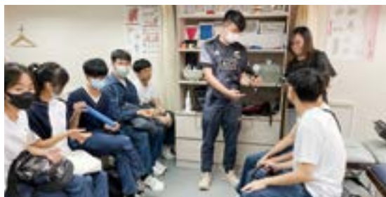
▲ 學生在 Career Day 走出校園，到物理治療診所參觀。

自這項安排實行之後，學生在活動中的投入度提升。以前，每年總會有學生表示，對所有嘉賓的職業都沒有興趣，選不上任何一組，但近年卻很少出現這情況。在活動過程中，學生亦表現得更投入，樂於向嘉賓提問，甚至向對方詢問聯絡方式。