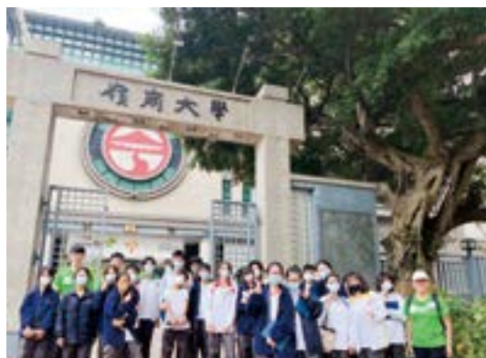
▲ 學生加強與高等及延續教育院校作有意義的接觸，重視學生與大專人員的互動交流。

為使學生有更多出路選擇，配合「基準九：與高等及延續教育院校作有意義的接觸」，學校主動連繫全港約三分之一高等教育院校，並邀請部分院校為校本的「升學資訊及體驗博覽」提供互動式體驗活動，讓參與學生嘗試動手學習與大專課程相關的知識及技能，更理解不同大專院校的課程內容。