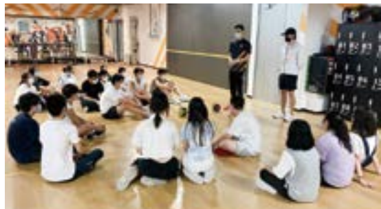
▲ 在校內體驗新興運動。

首屆 APFS 完成後，學校收集參加學生的自我反思及 VASK 自評，再由跨部門工作小組與社區連結專員共同深入評估每位學生的情況，又持續與基督教女青年會協作，為該批學生於升讀中五後繼續提供生涯發展活動。