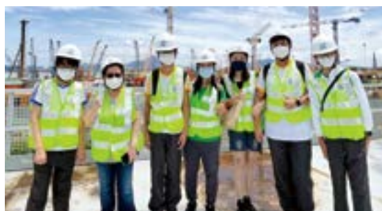
▲ 藉著參觀活動，家長了解到土地發展工程中的工作崗位，增加對不同職業的認識。