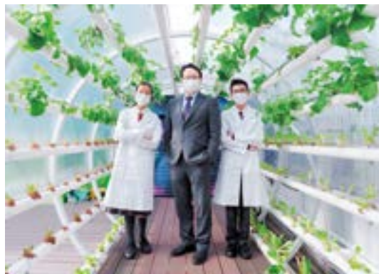
▲ 校園重視情景學習，校園設備愈益豐富，有利於推行生涯發展體驗，例如曾連繫大專院校，作有關水耕種植的科學分享。

「透過與高等及延續教育院校作有意義的接觸，能幫助學生擴闊升學的眼界，意識到追求目標並不僅限於單一路徑，而是有多種選擇，增加對未來發展的信心和把握。」