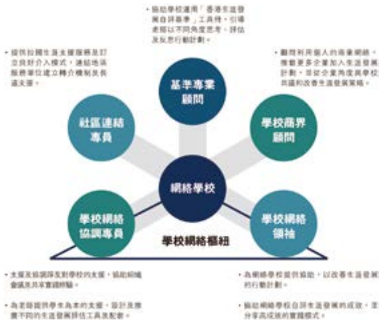
▲「香港生涯發展自評基準」(HKBM) 跨界別團隊就學校生涯發展自評及行動計劃為每所學校提供評友支援 (Critical Friend Support)。