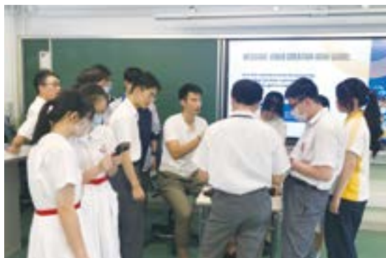
▲ 學生參與聯校職業博覽活動，與專業人士交流。

而在家長參與方面，學校會透過家長晚會，向家長提供升學和選科相關的訊息，讓他們對這些事有更清晰的概念。此外，學校更藉計劃的聯繫，與「學校網絡樞紐」(School Hub) 內的學校合作，舉辦聯校家長活動，各自邀請家長分享自己的工作經驗，藉此擴闊家長視野，為他們提供多元出路資訊。