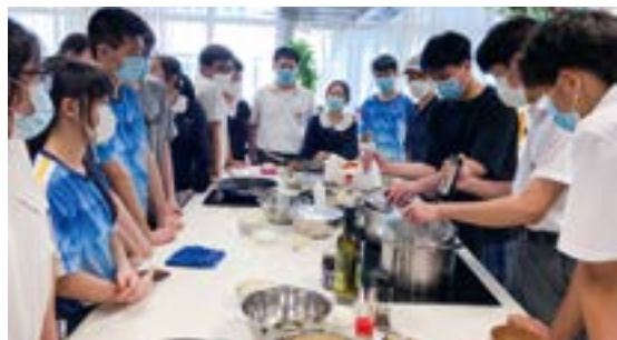
▲ APFS 為學生提供各種興趣探索活動。