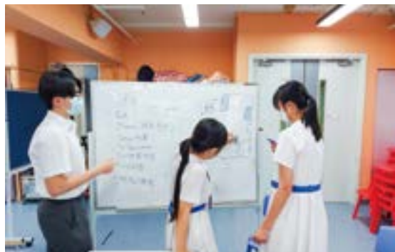
▲ 學生體驗策劃開設咖啡室的過程。

學校和我們社區承托夥伴會進行「跨專業三方會議」，運用客觀和有理論基礎的方法評估學生生涯發展需要，分享學生在學校、參與活動及參與社區活動後的改變，讓老師更了解學生在校外的參與情況。