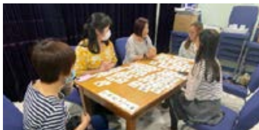
▲家長參與生涯發展工作坊，學習使用 VASK 卡。