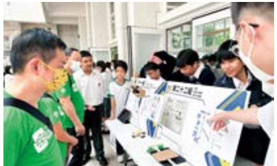
▲ 學校連繫嶺南大學，邀得「樂齡科技大使」出席學生的設計發布會，學生與業界人士有更多交流互動的機會。

為進一步豐富學生與工作世界接觸的經驗，學校亦會藉不同組別教職員及外界單位的協作，積極安排所有學生有機會參與最少一次職場學習體驗；並讓部分學生參加由社區機構發動的師友計劃，連續數年跟隨一位師友建立個人生涯發展目標，期間會跟隨對方參觀職場，擴闊視野。學校更主動與職業訓練局聯絡及協作，為中六同學爭取試後工作實習，進入真實工作世界，擔任實習崗位。