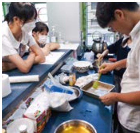
▲ 在基督教女青年會的安排下，學生參加職業探索體驗。

完成一年的 APFS 後，社區連結專員大致了解每位學生的意向，並向社區服務單位交代學生的情況，從而提出相應的活動建議。「當 APFS 退場之後，會由社區單位承接整個服務，根據不同的情況提供持續性的服務。社區服務單位與學校緊密合作，因應服務規模而作出調適。」