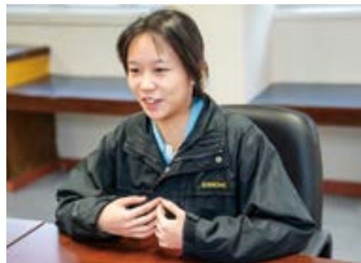
▲ 有了「聯校 KOL 訓練計劃」的經驗，令鄧同學更認識自己及工作世界，讓她感到未來充滿可能性。

各校可派學生參加六次訪問及製作影片技巧工作坊。在整個籌劃及執行過程中，由 HF 擔任協調的角色，並為其中一位工作坊導師。活動完結後，各網絡學校把 EA 的訪問片段帶回校內，跟全校師生分享，成為寶貴的生涯發展教育資源。