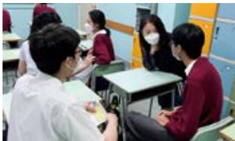
▲ 學校商界顧問在職業博覽會中向學生親述職場實際經驗，讓學生獲取第一手的資訊。

首次自評後，學校決心提升「基準八：與工作世界作有意義的接觸」，根據 HKBM 指引，全面為學生提供不同程度的工作認識與職場學習。首先，在與職場人士交流方面，以往學校多以講座形式進行，由一位嘉賓向全級學生分享，後來得到「學校商界顧問」(Enterprise Advisor, EA) 的安排，每年為中四、中五學生舉行兩次職業博覽會，每次邀請來自不同行業的嘉賓，讓學生從個人興趣出發，選擇聆聽哪位嘉賓分享，更貼近他們的個人需要，與學校緊密合作，攜手為學生的生涯發展提供建議。