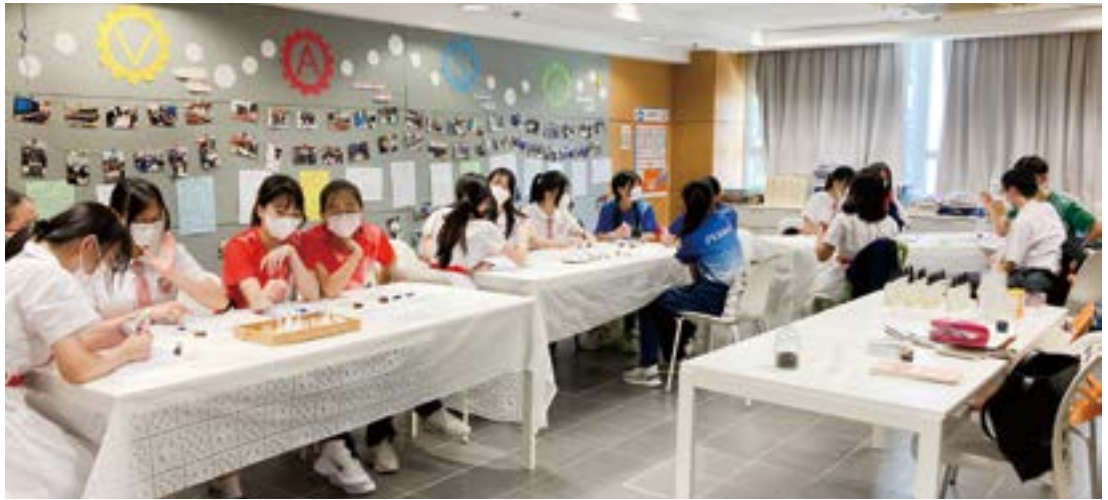
▲ 生涯發展教育需配合各種豐富的體驗活動，讓學生從中認識個人特質、興趣，探索多元出路。圖為校內舉行之調香體驗工作坊。