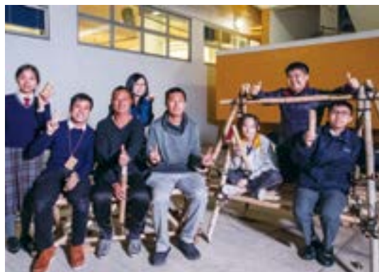
▲ 互動式職業學習體驗有助學生更了解實際工作的情境及所需的態度、價值觀及技能，圖中學生向搭棚師傅學習搭建棚架。