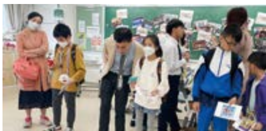
▲學校開放日時，運用 CLAP@JC 的資源及工具，介紹生涯發展概念。

「學生的生活圈子不夠闊，較少機會接觸不同行業，未必清楚學科相關的出路，以為大學修讀化學只能當老師、化驗師，其實與治療相關的專科，也離不開化學知識。不同種型的治療師，如職業治療師 (OT) 及物理治療師 (PT)，工作內容亦有差別，值得安排不同活動，讓學生仔細了解。」